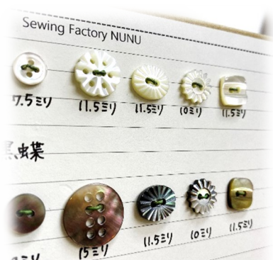
最近入荷した、かわいいボタン達 ( ¥120 ~ )

服作りに欠かせないボタンですが、その素材は様々です。既製服を中心に多く使われているポリエステル樹脂は、加工がしやすく、安価です。一方、天然素材のボタンには、木、水牛、貝、竹、革などがあります。どれも天然ならではの個性と希少性があり、それらをうまく使うことで、服がぐっとグレードアップします。NUNUにも最近ちょっとかわいい貝ボタンが仲間入りしました。