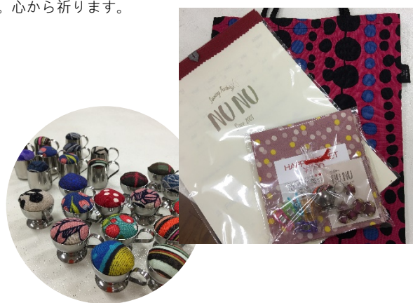
右写真は、昨年2020の福袋

限定35個。¥2,021です。 ご予約受付開始は12月8日(火)10:00~ お渡しは、2021年1月5日より