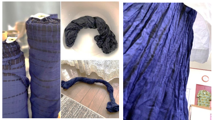
有松絞り 115cm幅 綿100% ¥2,200/m

右写真は、その有松絞りで作ったスカートを濡れたままねじり、そのまま乾かして仕上げた“くしゅくしゅスカート”です。繊細な絞りの模様と、できたしわでニュアンスのあるスカートが出来ました。