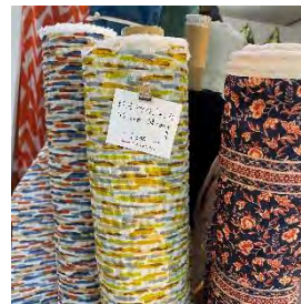
#60 ローンソフトウェーブ 綿 100% 115cm 幅 ¥1,800/m