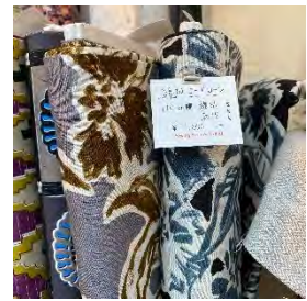
綿麻コードローン 綿 85% 麻 15% 110cm 幅 ¥1,200/m