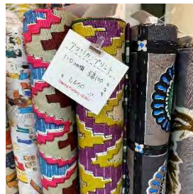
アフリカンプリント 綿 100% 110cm 幅 ¥1,600/m