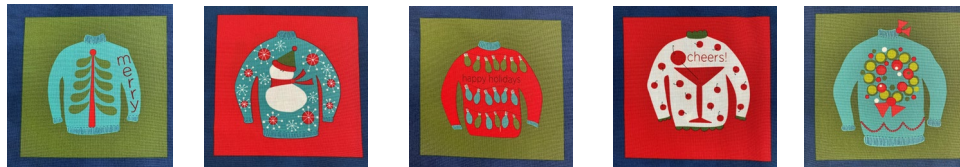
moda Christmas collection 1パネル(約110×60cm) ¥972 より

さあ、いよいよ師走です！今年中にやりたいこと、どれくらい達成できるでしょうか？ワールドカップの行方を気にしつつ迎える年末は、いつもよりさらに忙しく、速く過ぎていくような気がします。それでもクリスマスには何かしら手作りの温かい贈り物を用意したいと欲張ってしまいます。思い浮かぶ顔ぶれにぴったりのプレゼントを・・・思いを巡らす時間は幸せなひと時となります。