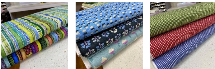
moda 新柄 綿100% 110cm幅 ¥1,620/m