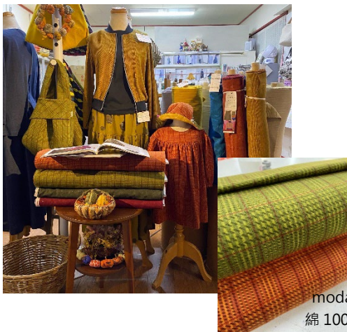
moda FLANNEL 綿 100% 110cm 幅 ¥1,620/m

10月は、年度下半期の始まりということで、ちょっとした節目となる月です。季節も進み、温かい食べ物が恋しくなります。変化のない毎日の中で、確実に季節が移っていくことは、日々の刺激となり意欲へとつながります。読書の～、芸術の～、食欲の～、スポーツの～、そしてファッションを楽しむ秋。寒くなるまでの短い時間が、豊かな時間になりますように。“ちくちく”するのもおすすめです。